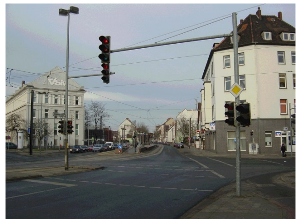
(Eingang zu Hainholz – Sitz der VSM AG)

Im Verlauf der kommenden Monate werden weitere starke Partner im Interesse der Gebietsentwicklung akquiriert, die sich für die Stärkung der lokalen Ökonomie einsetzen, um so